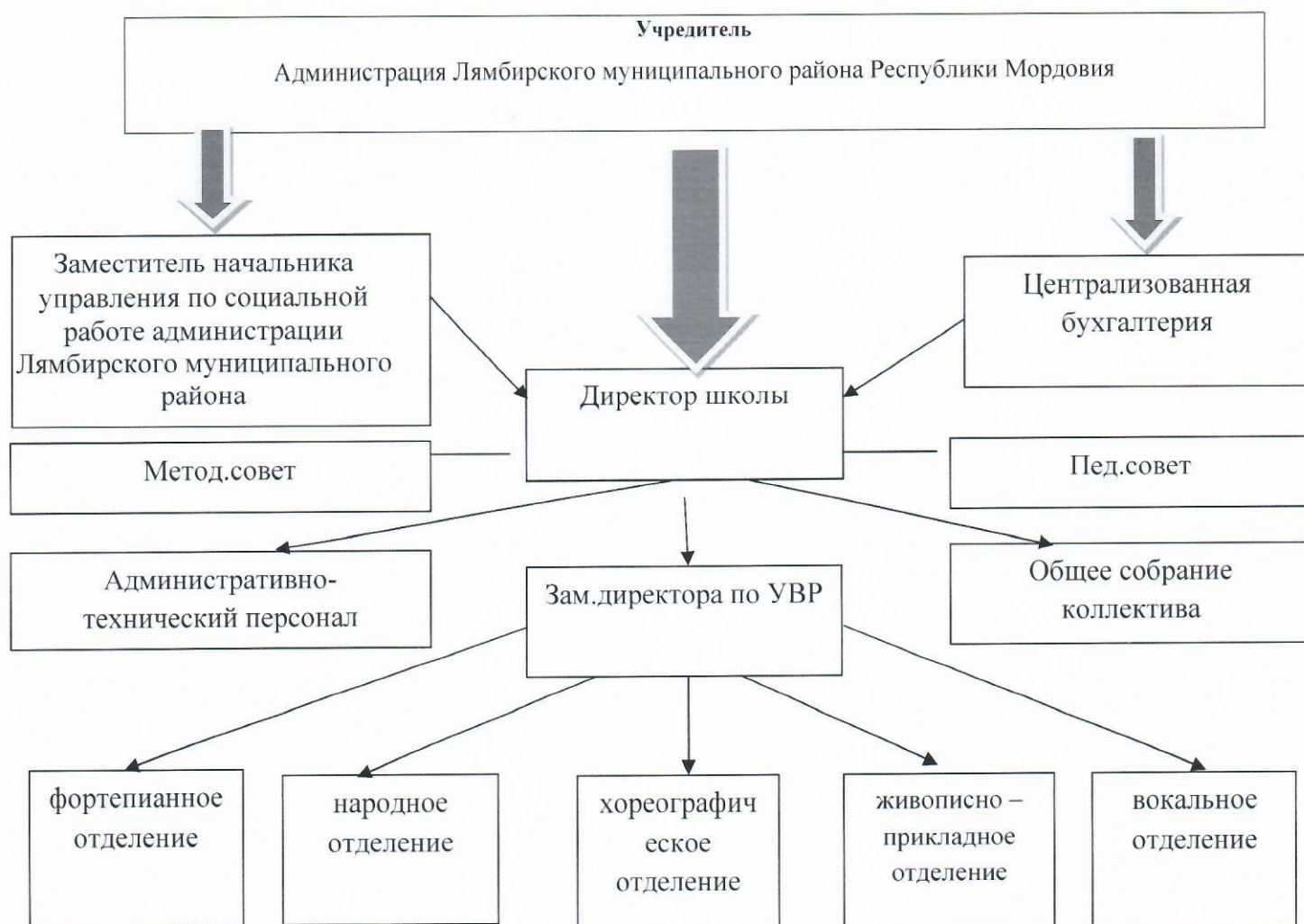
Схема структуры управляющей системы ДШИ

В 2020-2021 учебном году МБУ ДО «Лямбирская ДШИ» вела учебную деятельность по следующим дополнительным общеобразовательным программам: